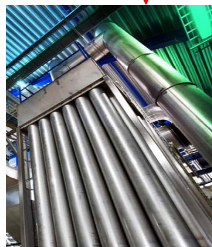
NAT ELEKTRO- STATISCH FILTER